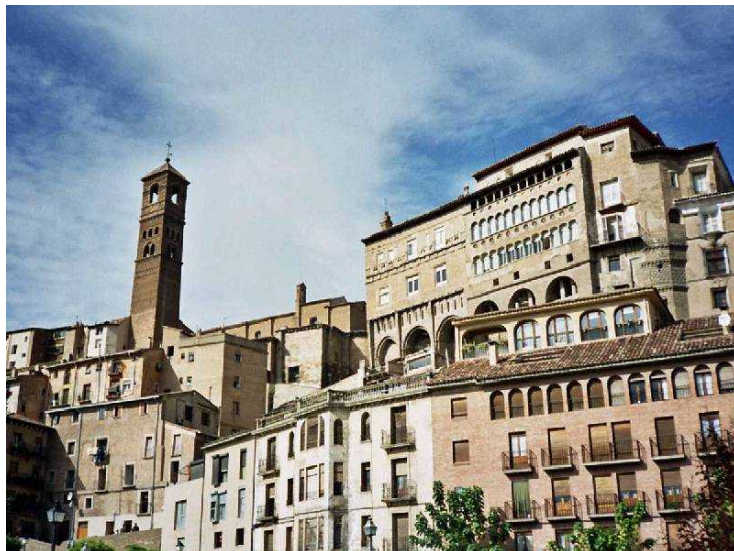
Tarazona herriaren ikuspegia